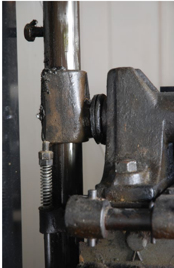
De vanginrichting: dit veiligheidssysteem, vanaf 1853 door Otis ontwikkeld, verhindert dat de liftkooi valt bij een kabelbreuk.

De liften van vóór 1 juli 1999 hebben een eerste risicoanalyse ondergaan (vóór 10 mei 2008 ten laatste) door een Externe Dienst voor Technische Controles (E.D.T.C.). Om de 15 jaar wordt een nieuwe risicoanalyse uitgevoerd om na te gaan of de lift nog steeds voldoet aan de van kracht zijnde veiligheidseisen. Door de risicoanalyse kan de aandacht op de verschillende risico's worden gevestigd: de meest ernstige die de stopzetting van het toestel en het onmiddellijk terug in orde maken ervan vereisen, en deze waarvoor een modernisatie noodzakelijk is.